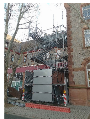
Fluchttreppe A-Bau, Südflügel

Die Schadstoffsanierung im Z-Bau soll bis Ende Januar 2024 abgeschlossen werden. Der zweite Bauabschnitt, Z-Bau, soll bis Ende 2024 abgeschlossen werden.