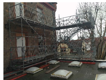
Anschluss Fluchttreppenturm, A-Bau