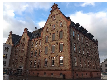
Nordflügel A-Bau Einweihung im November 2023