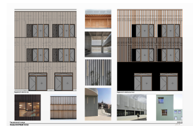
Variantenstudie Fassade, Stand Sept. 2023