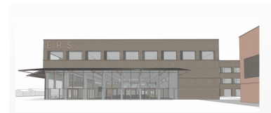
Perspektive Eingangsbereich außen, Stand Juli 2023

Die Vergabe und der Leistungsstart für die Planung der Interimgebäude wird voraussichtlich im April 2024 stattfinden. Die Abgabe der Gesamtplanung für die Leistungsphase 3 ist für den 17.05.2024 geplant.