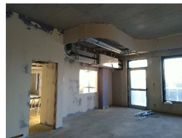
Klassenraum - Blick auf dezentrale Lüftung und Tür/Blickfenster zu Differenzierungsräumen