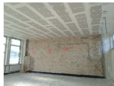
Sanierung - Abhangdecke