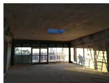
Blick auf Erschließungsfläche zwischen den Clustern im 2. OG