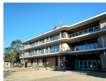
Ansicht West, Fassade Haupteingang und Nord-Cluster

Die Dacharbeiten sind bis auf Kleinigkeiten und die PV-Anlage fertiggestellt.