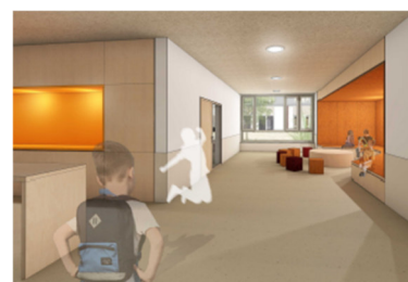
Neubau Marktplatzbereich Innenraumperspektive