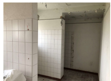
Ausbau Sanitäröbekte Turnhalle