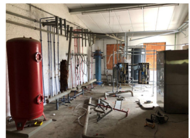
Ausbau Technik Kegelbahn