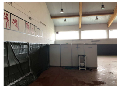
Sanierungsbereich - Turnhalle