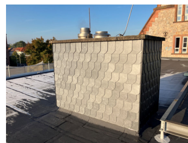
Saniertes Dach Z-Bau