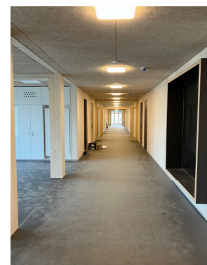
Innenausbau kurz vor Fertigstellung