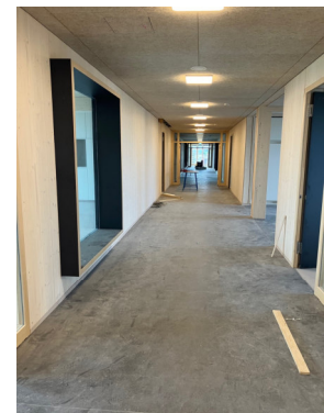
Innenausbau kurz vor Fertigstellung

Die Außenanlagen werden im laufenden Schulbetrieb bis voraussichtlich zum Jahresende 2025 durchgeführt. Eine Nutzung der Gesamtanlage ist für das neue Jahr vorgesehen. Im Zuge der Bearbeitung der Außenanlage wird nun zusätzlich eine Kanalsanierung in diesen Bereichen durchgeführt.