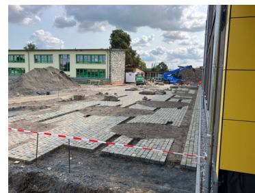
Arbeiten an Außenanlage