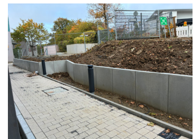
Außenanlage 1. BA