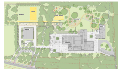
Lageplan: Entwurf Gesamtanlage (09/2025)