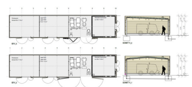
Betriebshof: Varianten zu Dachform und Tür- / Torausbildungen