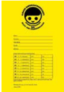
Health checkup planner for babies

For each newborn child, women receive a planner with a schedule of all health checkups for their baby. In this planner all health checkups for children and young people up to their 14th year are recorded. Here is a checklist: