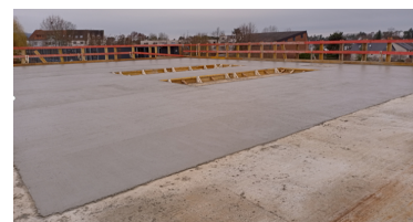
Oberste Geschossdecke Bauteil 0