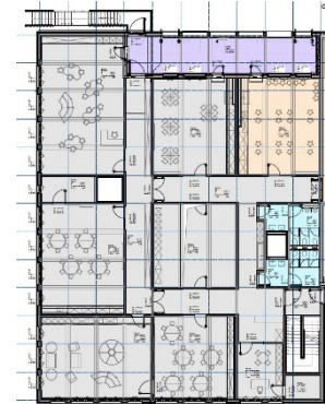
Ausschnitt Grundriss Ganztage