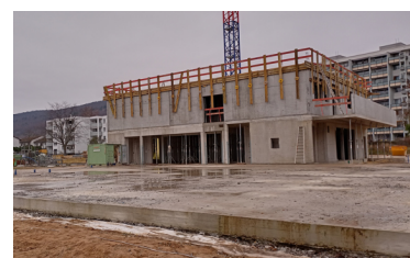
Rohbau Bauteil 0-1