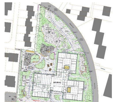
Ausführungsplan Nord, 1. BA