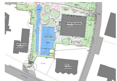
Ausführungsplan Süd, 2. BA