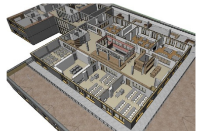
NaWi / Werken OG