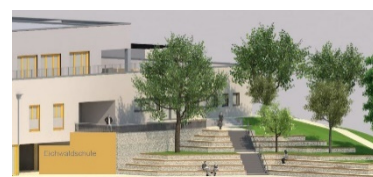
Zentraler Hof mit Stufenanlage