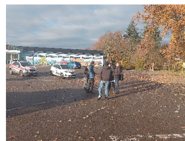
Ortstermin Interim, November 2023 Schwimmbad, Schaaheim

Die Ausschreibung für die Rodungsarbeiten im Zusammenhang mit der Herstellung der neuen Feuerwehrezufahrt wurde veröffentlicht. Die Freianlagen werden in zwei Bauabschnitten ausgeführt, vor und nach Errichtung des Gebäudes.