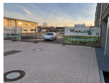
Außenanlage 1. BA