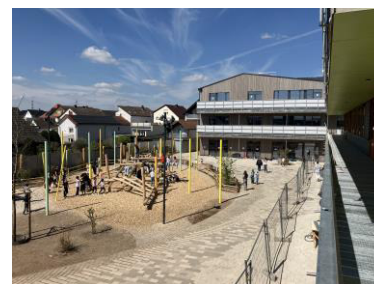
ALS Pausenhof mit Spielgerät

Die Holzverkleidung des Laubenganges soll bis Mitte Juni 2026 montiert sein.