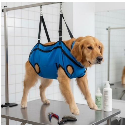
Abbildung 6: Hund in einer „Hängematte“ zur Fixation für Pflegemaßnahmen (KI-Bild generiert mit Google-Gemini).

Wichtig ist es, bereits Welpen an gängige Pflegemaßnahmen zu gewöhnen und ggf. ein „Medical training“ unter fachlicher tierärztlicher Anleitung durchzuführen, um auf tierschutzwidrige Hilfsmittel zur Hilflosigkeit des Tieres verzichten zu können.