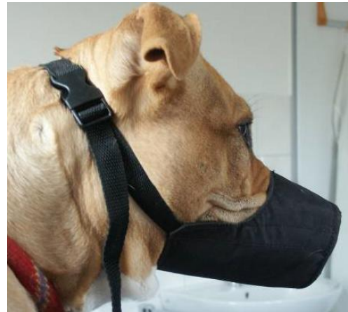
Abbildung 4: Auf die Anwendung von geschlossenen Nylonmaulkörben sollte verzichtet werden

Die Gewöhnung an einen Maulkorb muss kleinschrittig und mit positiver Verstärkung erfolgen (siehe auch TVT-Merkblatt Nr. 145 - Trainingsplan zur Gewöhnung an das Tragen eines Maulkorbes beim Hund).