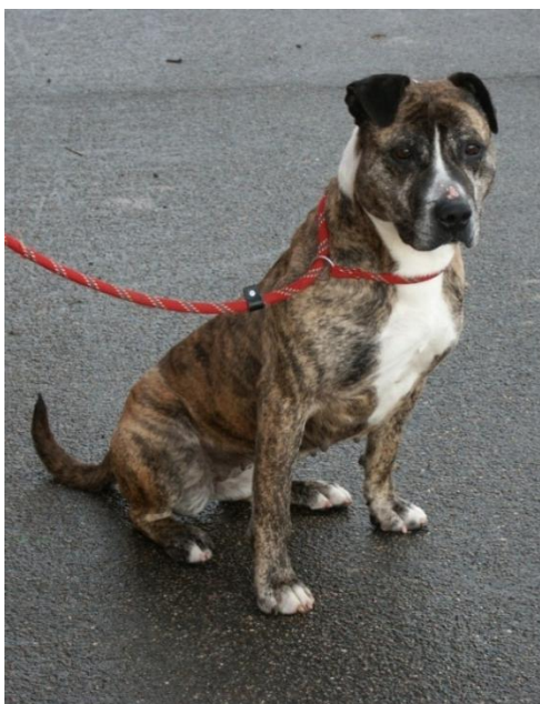
Abbildung 3: Zughalsband mit falsch eingestelltem Stopp

Generell lassen sich Zughalsbänder mit und ohne Stopp unterscheiden. Das bedeutet, dass das Zuziehen des Halsbandes ab einem bestimmten Punkt gestoppt wird („Stoppwürger“), oder eben nicht („Endloswürger“, falsch eingestellte „Moxon- oder Retrieverleinen“). Ein verstärktes Zuziehen des Halsbandes wirkt direkt auf Kehlkopf, Luftröhre und die Blutversorgung ein und kann zu nachhaltigen körperlichen Schädigungen (z. B. Atemnot, Erhöhung des Augendruckes) bis hin zur Strangulation führen. Ein Halsband ohne Stopp oder mit nicht korrekt eingestelltem Stopp (freies Atmen muss jederzeit sichergestellt sein) ist tierschutzwidrig (Abbildung 3) und fällt unter das Verbot von § 2 Abs. 5 TierSchHuV.