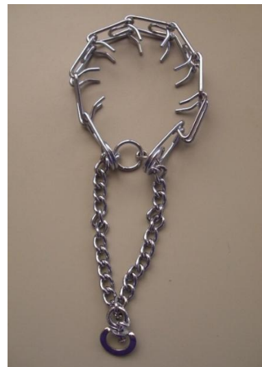
Abbildung 2: Stachelhalsband mit nach innen gerichteten Stacheln

Die Wirkung des Stachelhalsbandes beruht auf einem schmerzinduzierten Strafreiz (Abbildung 2). Die Verwendung von Stachelhalsbändern, auch Korallenhalsband genannt, ist seit dem 01.01.2022 explizit verboten (§ 2 Abs. 5 TierSchHuV: „Es ist verboten, bei der Ausbildung, bei der Erziehung oder beim Training von Hunden Stachelhalsbänder oder andere für die Hunde schmerzhaft Mittel zu verwenden.“).