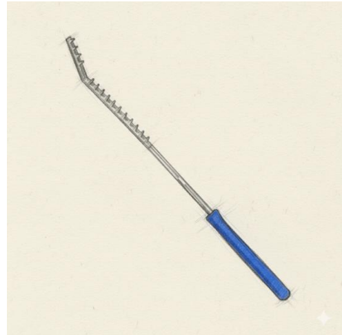
Abbildung 1: Skizze eines Positionsstabs (KI-Bild generiert mit Google-Gemini).

Ein Positionsstab ist ein Metallstab mit abnehmbarem Winkel und Griff, der häufig kleine Metallzacken aufweist, die in Richtung des Hundes ausgerichtet sind (Abbildung 1). Mit diesem Metallstab, den Hundeführerinnen oder Hundeführer in ihren Händen halten, wird der Hund vor bzw. seitlich der Brust oder im Kopfbereich begrenzt, um eine bestimmte („korrekte“) Position beim Fußlaufen zu erreichen. Der Hund erfährt einen schmerzhaften Strafreiz im Kopf-, Brust- oder Halsbereich, wenn er gegen die gezackte Metallstange läuft bzw. mit dieser in Kontakt kommt. Der Positionsstab ist als tierschutzwidriges Druckmittel einzustufen und fällt unter das Verbot von § 2 Abs. 5 TierSchHuV.