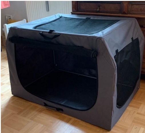
Abbildung 5: Eine geschlossene Hundebox ist keine geeignete Unterbringung für einen Hund © Deutscher Tierschutzbund e. V.

missbräuchlich als „Erziehungshilfe“ oder als „Parkplatz“ für ihre Hunde verstehen und einsetzen. Durch den Stress des Eingesperrtseins können sich beispielsweise Angst- oder Aggressionsverhalten verstärken und zu Verhaltensstörungen entwickeln. Diese bedeuten für das betroffene Tier erhebliche Leiden und können sogar zu einer Abgabe des Tieres führen.