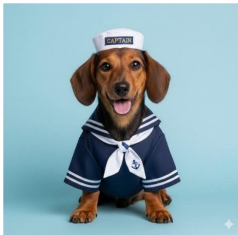
Abbildung 8: Hund in einem Kostüm (KI-Bild generiert mit Google-Gemini).

Es handelt sich hier um Verkleidungen jeglicher Art bspw. Faschingskostüme (Abbildung 8), Mützen, Perücken etc. die lediglich zur Belustigung des Menschen dienen und keinen Zweck für das Tier erfüllen. Insbesondere sog. Petfluencer bedienen sich solcher Accessoires. Die sich wiederholende Stresssituation (Anziehen, „Zurechtrücken“ und Dulden-müssen des Kostümes) kann zum Auftreten von angst aggressivem Verhalten des Hundes führen. Darüber hinaus wird die innerartliche sowie artübergreifende Kommunikation erheblich eingeschränkt und es liegt kein vernünftiger Grund im Sinne des §1 TierSchG vor.