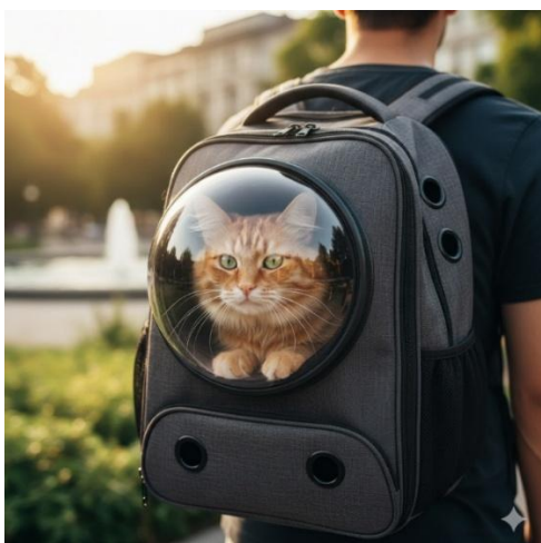
Abbildung 2: Katzenrucksack mit „Bullauge“ (KI-Bild generiert mit Google-Gemini).