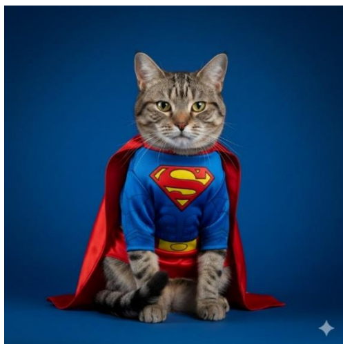
Abbildung 3: Katze mit Verkleidung (KI-Bild generiert mit Google-Gemini).

Es handelt sich um Verkleidungen jeglicher Art bspw. Faschingskostüme (Abbildung 3), Mützen, Rucksäcke, die zur Belustigung des Menschen dienen und keinen Zweck für das Tier erfüllen. Insbesondere sog. Petfluencer bedienen sich solcher Ausdrucksmittel. Aufgrund der Bedrängungssituation (Anziehen, wiederholtes „Zurechtrücken“ und Dulden müssen des Kostümes) kann es auch zum Auftreten von angst aggressivem Verhalten der Katze kommen. Die innerartliche sowie artübergreifende Kommunikation wird erheblich eingeschränkt und es liegt kein vernünftiger Grund im Sinne des §1 TierSchG vor.